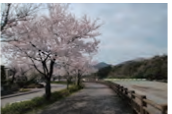
秋川橋河川公園 遊歩道